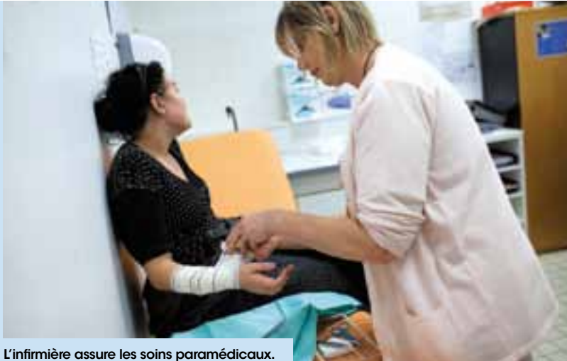
L'infirmière assure les soins paramédicaux.