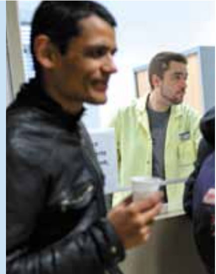
La PASS Rimbaud s'appuie sur une équipe pluridisciplinaire : deux généralistes, une infirmière, un agent d'accueil et quatre assistantes sociales.